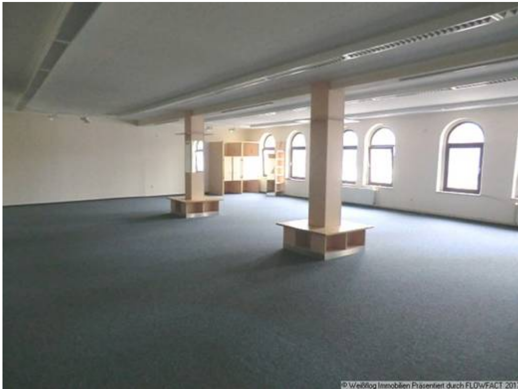
Verkaufsbereich 2 Obergeschoss