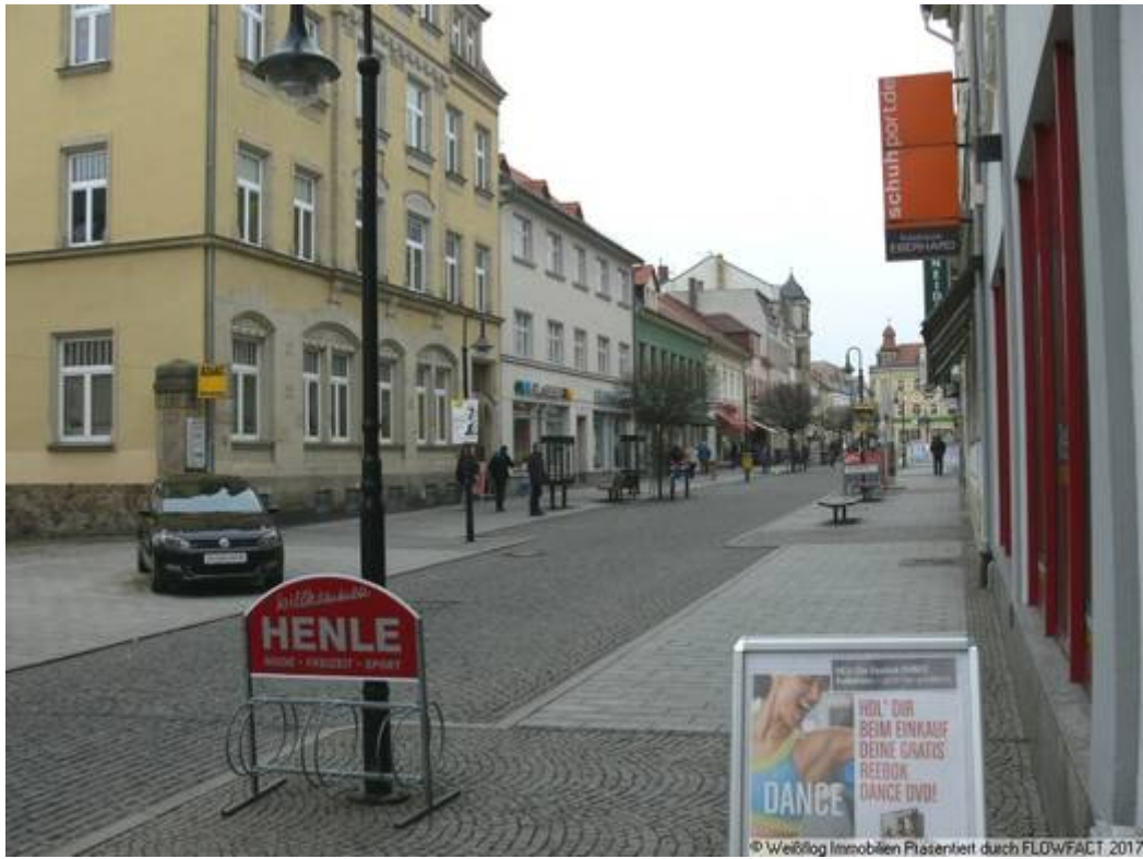
Ansicht Hauptstraße Richtung Rathausplatz